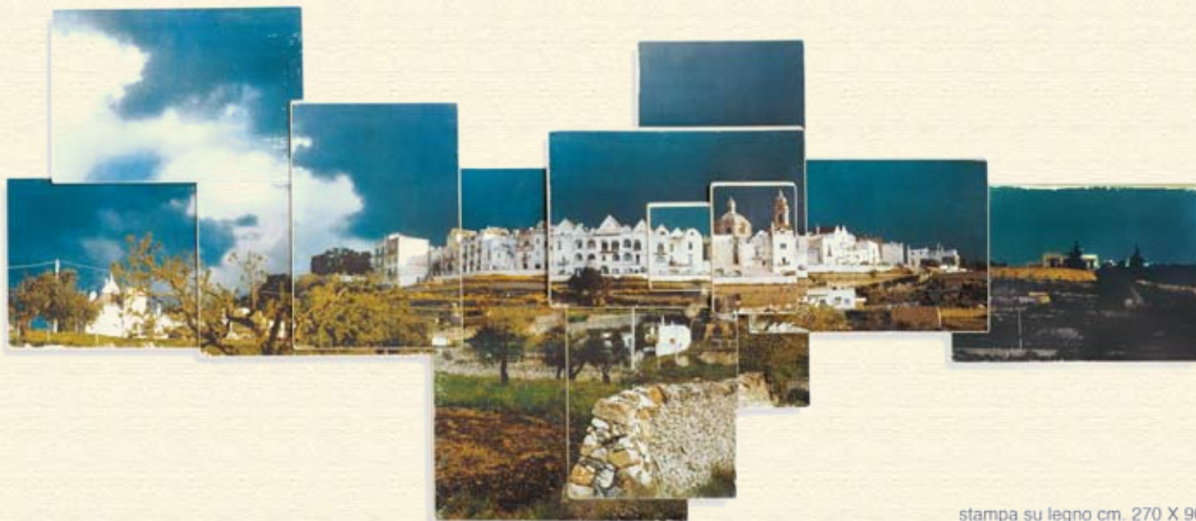
stampa su legno cm. 270 X 90

pevolezza: una connessione immediata con l'esistenza" dice Osho. E se da questa connessione scaturisce qualcosa di creativo, chiunque ne partecipa entra immediatamente in contatto con qualcosa di reale, la cui eco è semplice silenzio.