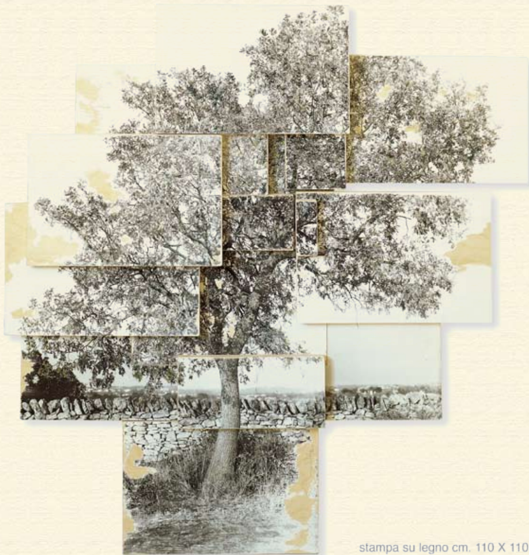
stampa su legno cm. 110 X 110