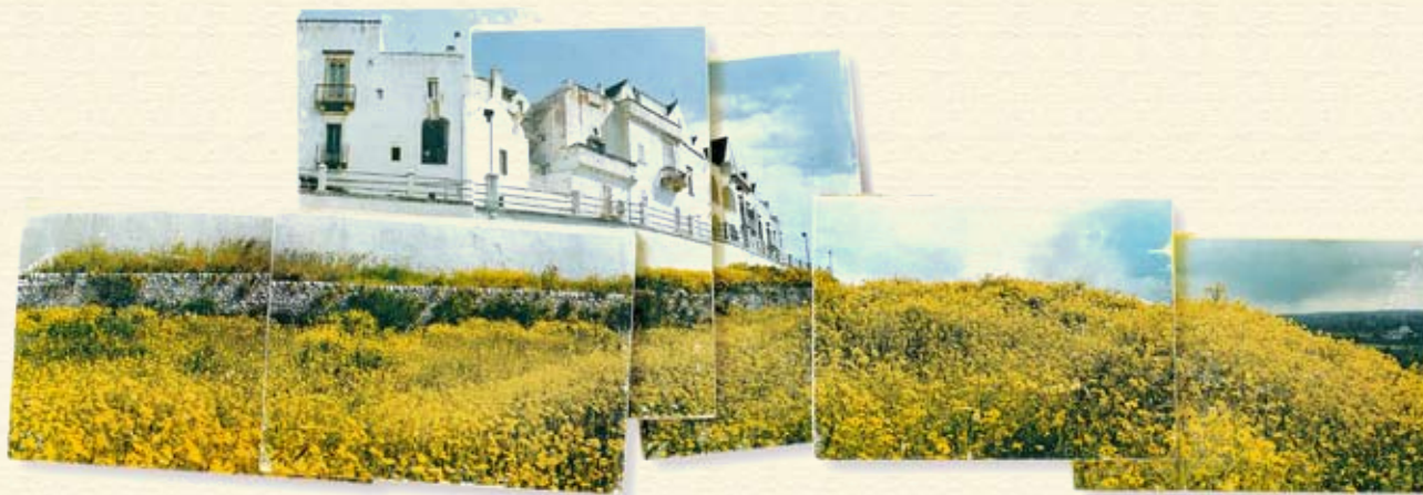
stampa su legno cm. 150 X 80

stessa che sia al tempo stesso espressione di un silenzio, di una comprensione, di un'amicizia nei confronti dell'esistenza. Solo questa chiarezza di visione può spezzare il caos del mondo e ricordare a chi partecipa di quest'arte che la vita resta comunque un cosmo, malgrado i colori torbidi che esso può assumere.